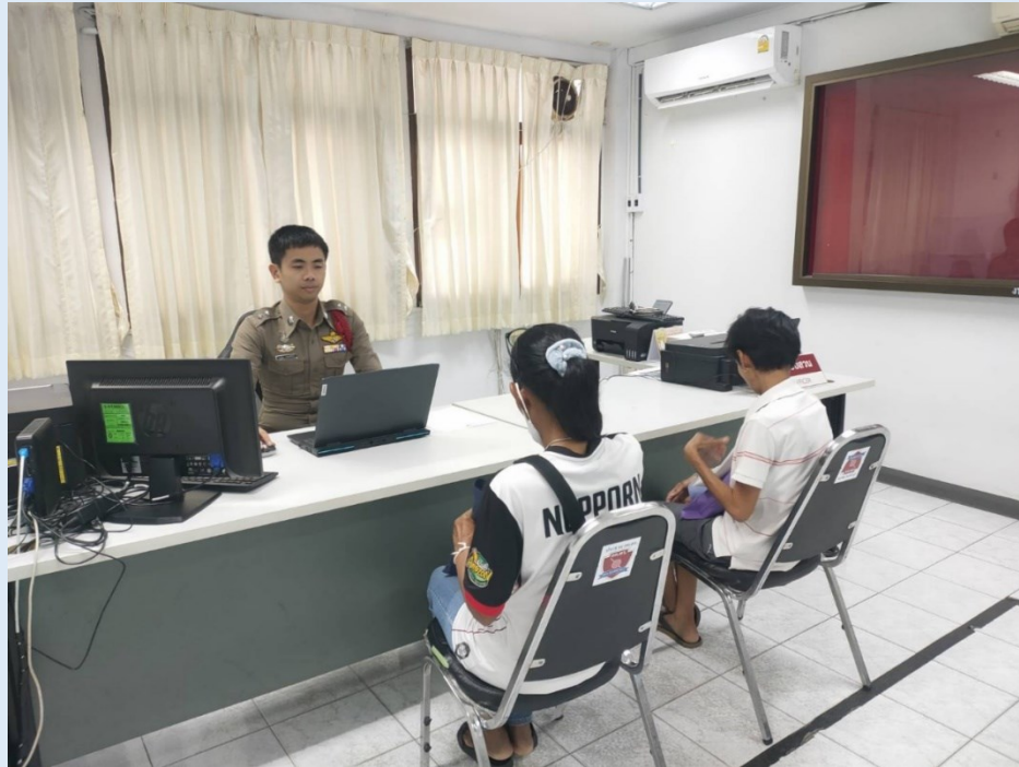
ภาพขณะที่ผู้เสียหายเดินทางมาพบพนักงานสอบสวนเพื่อแจ้งความร้องทุกข์ ปรีक्षाข้อกฎหมายต่างๆ