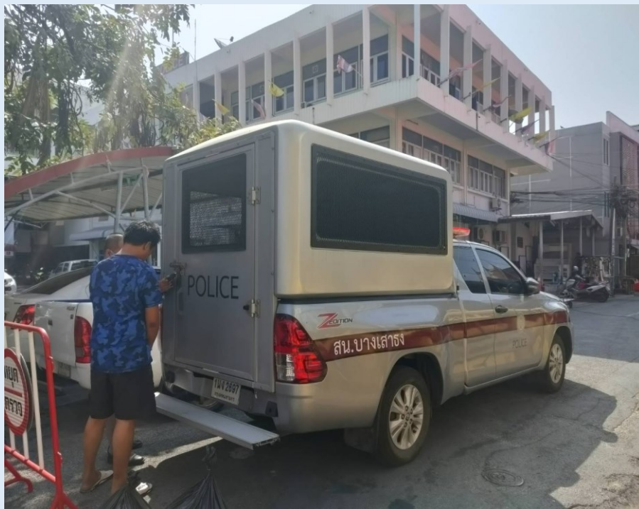
ภาพขณะที่พนักงานสอบสวน นำผู้ต้องหามาสอบปากคำ ส่งตัวนำฟ้องศาล