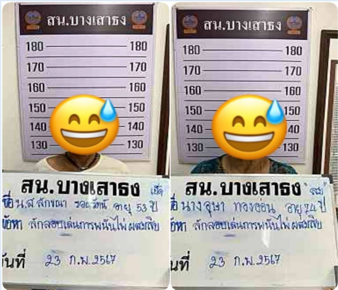
ภาพขณะที่พนักงานสอบสวน รั้บมอบตัวผู้ต้องหาจากเจ้าหน้าที่ตำรวจชุดจับกุมเพื่อบำดำเนินคดี